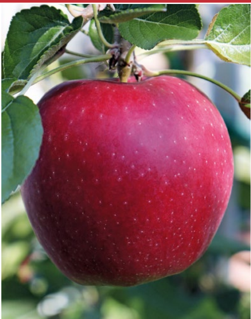
WA 38/Cosmic Crisp®