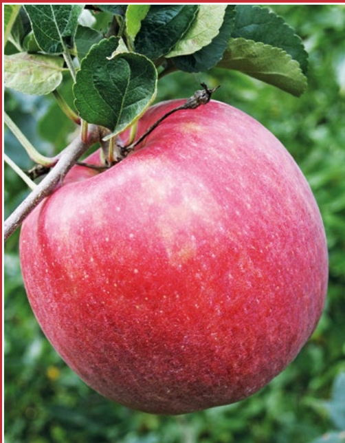
MC 38/Crimson Snow®