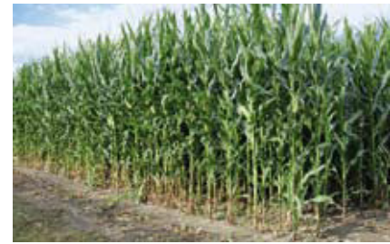
Düngemittelmarkt. Seite 265.