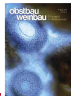
ZUM TITELBILD Konidien von Phomopsis mali , dem Erreger des Phomopsis-Rindenbrandes.