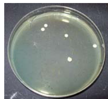
Brettanomyces-Hefen. Seite 271.