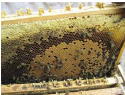
Schutz der Honigbiene. Seite 258.