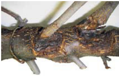
Rindenkrankheiten im Apfelanbau. Seite 253.