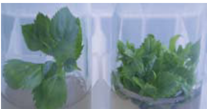
Forschungsarbeiten zur Apfeltriebsucht. Seite 6.