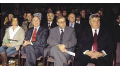
Qualitätssicherung in der Obstvermarktung. Seite 11.