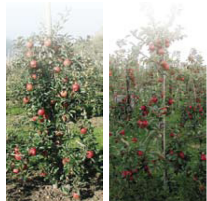
Mairac und Kanzi. Seite 14.