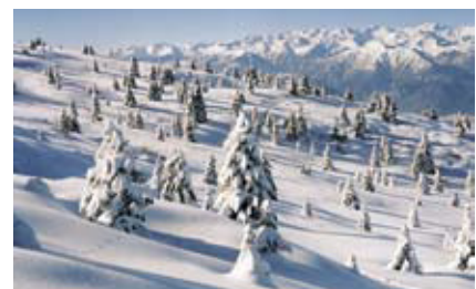
Die Witterung 2006. Seite 20.