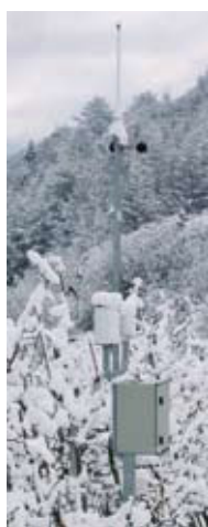
40 Jahre Wetter im Vinschgau. Seite 134.