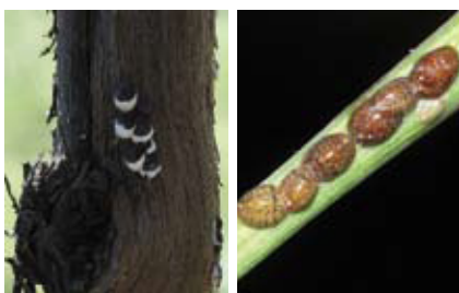
Schildläuse der Rebe. Seite 139.

Apfeltriebsucht erfordert weiterhin volle Aufmerksamkeit _____ 128