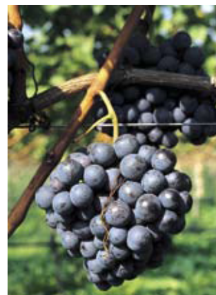
VZ - Versuche Weinbau 2007. Seite 142.