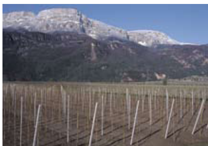
Planung Junganlage. Seite 129.