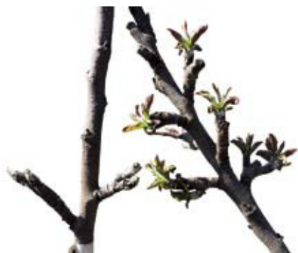
Apfeltriebsucht. Seite 164.