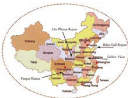
China: Apfelproduktion. Seite 166.