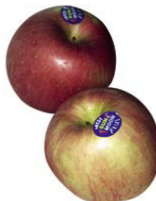
China: Apfelkonsum. Seite 169.