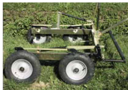
Erntehandwagen. Seite 234.