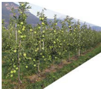
Anlagenerneuerung. Seite 230.

Südtirols Apfelmarkt startet mit Optimismus in die neue Saison ____ 224