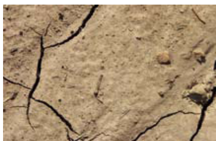
Zeichen der Klimaerwärmung. Seite 228.