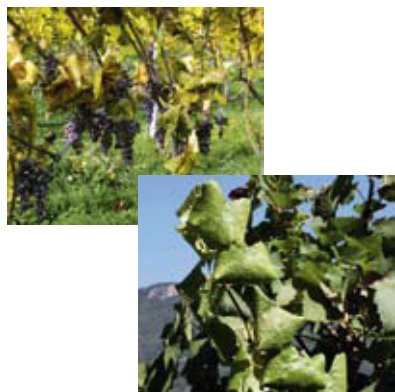
Schwarzholzkrankheit. Seite 261.

Damokles-Schwert über Ausdünnungsmittel _____ 252