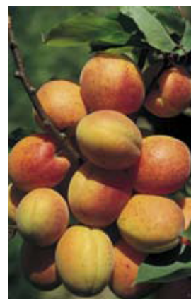
Marille und Gesundheit. Seite 265.