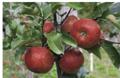
Ernteplus bei Bio-Äpfeln. Seite 264.