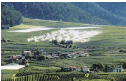
Boden und Bewässerung. Seite 253.