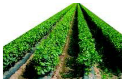
Weinanbau in Friaul. Seite 338.