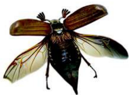
Maikäferflug steht bevor. Seite 329.