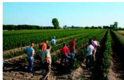
Studienreise Polen. Seite 333.