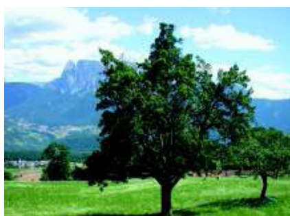
Situation Feuerbrand. Seite 327.