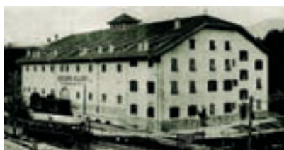
100 Jahre KG Kaltern. Seite 243.