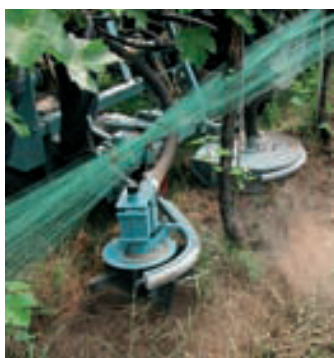
Tag der Technik im Weinbau. Seite 237.