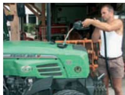
Biokraftstoff. Seite 252.

Biotechnologische Betrachtungen zur Marille, Teil II _____ 254