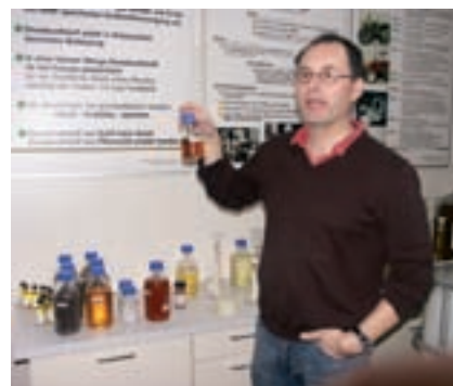
Biodiesel. Seite 188.