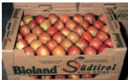
Produktionskosten - Vergleich. Seite 177.