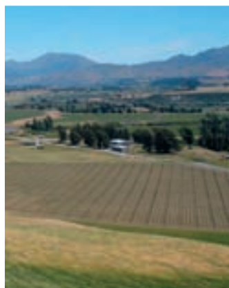
Studienaufenthalt in Neuseeland. Seite 184.

Gute Ausgangslage für die zweite Vegetationshälfte _____ 176