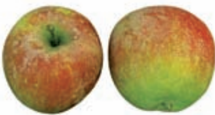
Der „Weiße Hauch“. Seite 181.