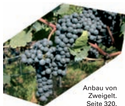
Anbau von Zweigelt. Seite 320.