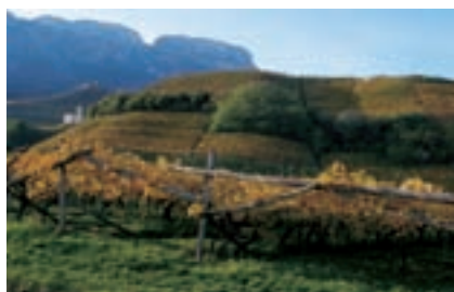
Weinanbauentwicklung in den Bezirken. Seite 306.

Zwischen Tradition und Fortschritt _____ 296