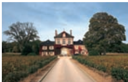
Weinbau weltweit. Seite 297.