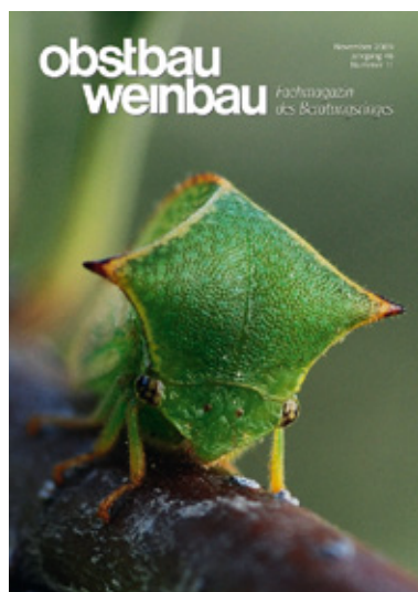
Die Buffelzikade: erstmals in Südtiroler Apfelanlagen gesichtet.

Maria Kiem · Tel. 0473 553400 E-Mail: maria.kiem@beratungsring.org Karin Pallabazzer · Tel. 0471 824400 E-Mail: karin.pallabazzer@beratungsring.org Es gilt die Anzeigenpreisliste 2009!