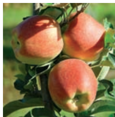
Ambrosia. Seite 364.