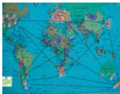
Sortenerneuerung. Seite 337.