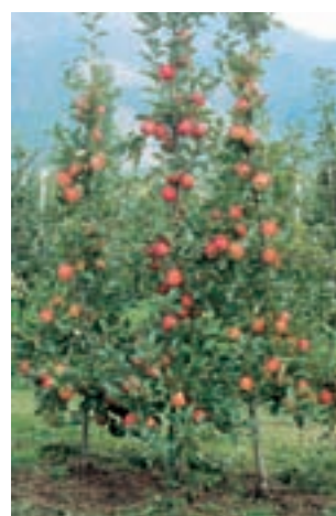
Rosy Glow. Seite 352.

Sortenzüchtung - ein globales Geschäft _____ 336