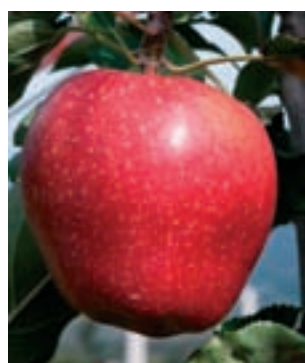
Cameo®. Seite 345.