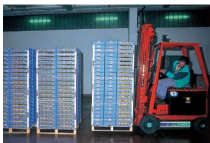
EUREPGAP. Seite 292.