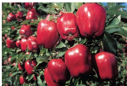
Der Apfel in der Welt. Seite 289.