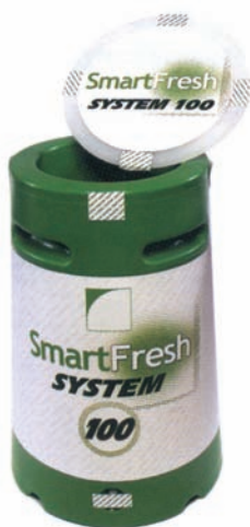
1-MCP. Seite 297.