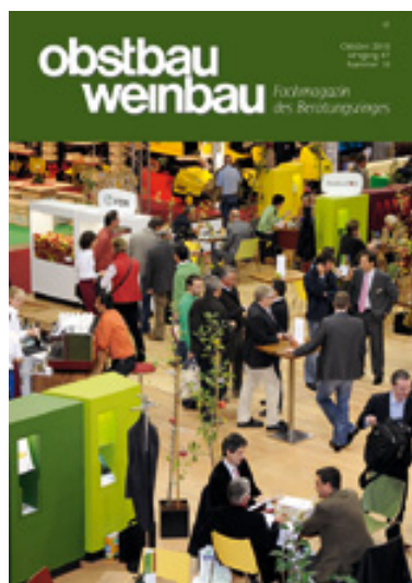
Interpoma 2010 vom 4. - 6. November.