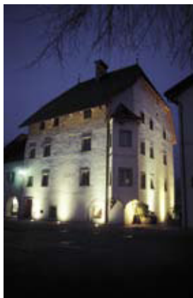
Weinbautagung 2007. Seite 94.