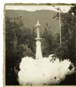
Vor 50 Jahren. Seite 111.