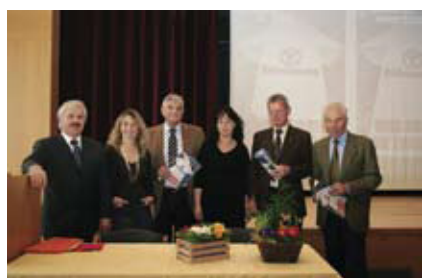
Jahresversammlung SBR. Seite 105.

Ein Leben für den Südtiroler Obstbau _____ 92