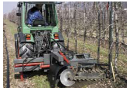
Grabenschnitten. Seite 109.