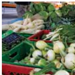
Pflanzenschutz mit geringem Pflanzenschutzmitteleinsatz