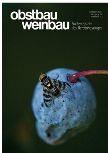
Rhagoletis berberis auf einer Mahonienbeere.

E-Mail: karin.pallabazzer@beratungsring.org