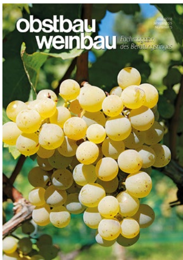
Kerner – eine der drei Leitsorten im Eisacktal.