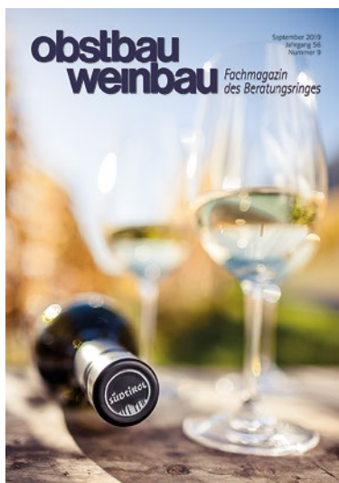
Die Südtirol-Kapsel ist heute auf 80% der Flaschen zu sehen.