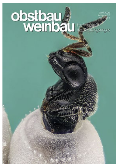
Eiparasitoid Trissolcus japonicus, Hoffnungs-träger im Kampf gegen die Marmorierte Baumwanze.