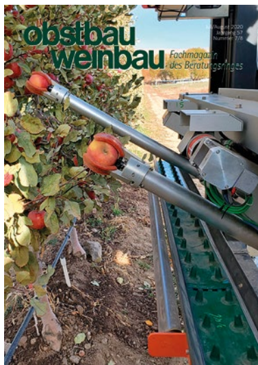
Ernten bald Roboter die Äpfel?