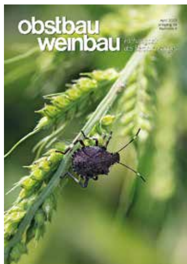
Nymphe einer M. Baumwanze im Unterbewuchs; entdeckt beim Monitoring.